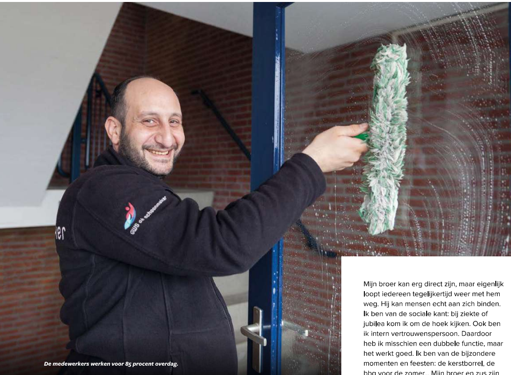
De medewerkers werken voor 85 procent overdag.

en meer op het mkb gaan richten. Nu doen we af en toe nog mee aan aanbestedingen, maar dan worden we daar wel voor gevraagd. Momenteel zijn we vooral actief op kantoren, voor VVE's en woningbouwverenigingen, culturele instellingen, hotels en scholen.